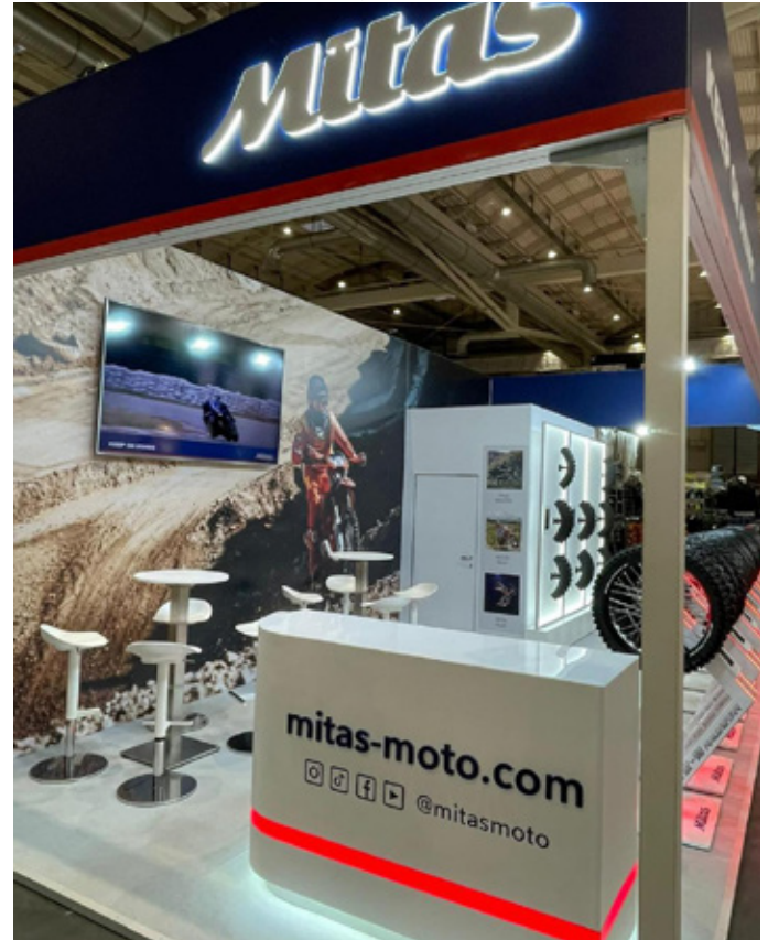
Hamburger Motorrad Tage (Hamburgo, Alemanha)