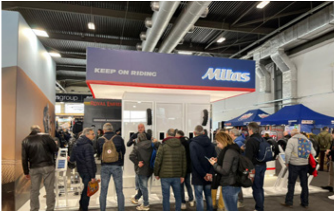
Motor Bike Expo (Verona, Itália)